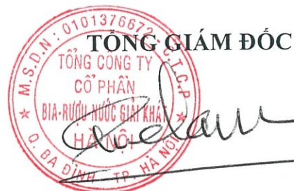
Ngô Quế Lâm